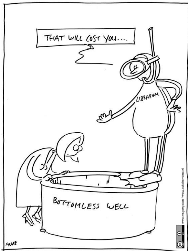
RECOVERY OF DATA